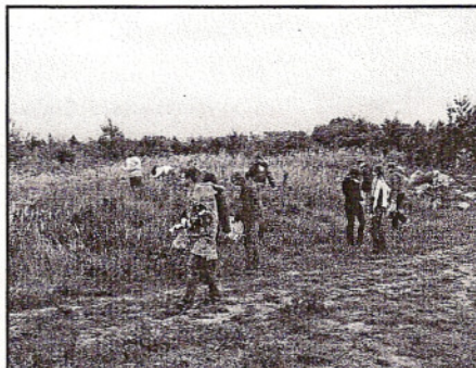
Klasa III b Gimnazjum w Ksawerowie