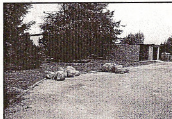
Śmieci zebrane przez młodzież

Wszystkim tym, którzy uczestniczyli czynnie w akcji serdecznie dziękujemy.