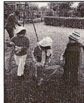
Gminne Przedszkole w Widzewie