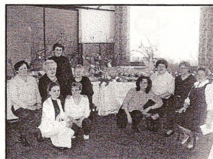
KGW w Nowej Gadce