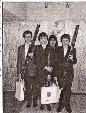
Nagrodzeni muzycy z Panią Wójt

Oprócz głównej nagrody uczniowie otrzymali dyplomy, książki z osobistą dedykacją pani Wójt Gminy Ksawerów oraz gadzety Gminy Ksawerów.