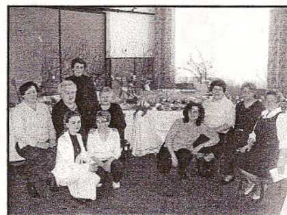
KGW w Nowej Gadce