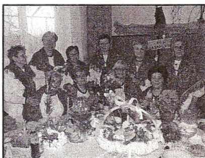
KGW w Ksawerowie