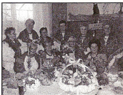
KGW w Ksawerowie