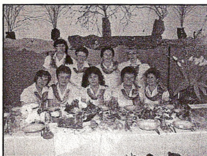
KGW w Woli Zaradzyskiej

Koła Gospodyń Wiejskich z terenu Gminy Ksawerów prezentują przygotowane przez siebie stoły: