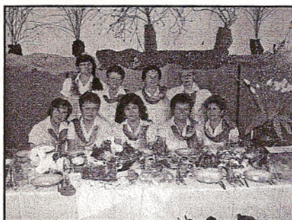
KGW w Woli Zaradzyńskiej

Koła Gospodyń Wiejskich z terenu Gminy Ksawerów prezentują przygotowane przez siebie stoły: