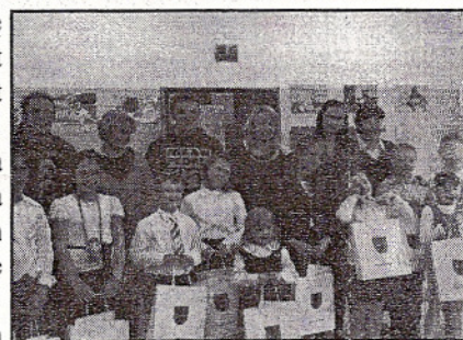
ZWYCIĘZCY Z AKTORAMI I NAUCZYCIELAMI

Zwycięska dziesiątka będzie reprezentowała Gminę Ksawerów w Wielkim Finale Konkursu „Świerszczykowe wierszyki”, który odbędzie się 29 maja 2010 roku o godzinie 10:00 w Łódzkim Domu Kultury, ul. Traugutta 18. Pozostaje nam tylko trzymać kciuki za naszych uczniów.