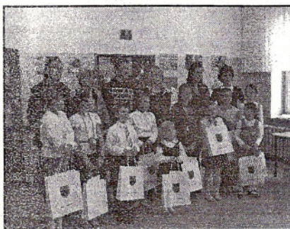
ZWYCIĘZCY ELIMINACJI GMINNYCH